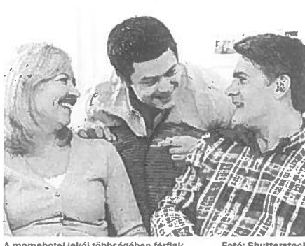
A mamahotel lakó többségében férfiak

A szülői ház elhagyása alapvetően pénz kérdése, és a legtöbb költözni vágyó fiatal felkészületlenül éri az elmúlt években tapasztalható jelenlegi lakbér- és ingatlanár emelkedést. Az önálló élet egyik legnagyobb akadályá is így a megfelelő anyagi háttér hiánya. Alátámasztja ezt a meg-