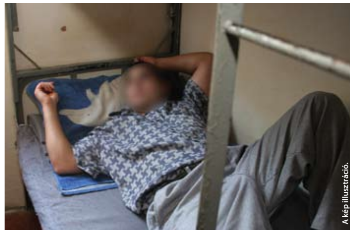
A kép illusztráció.

Velük talán a legnehezebb, hiszen épp a progresszivitás kerül ki a kezelési lehetőségekből, főleg akkor, ha a fogvatartott kapcsolata megszakadt a családjával is. Ebben az esetben megpróbáljuk az önbecsülését növelni. Ha elég jó az önbecsülése, és életosztóne segíti továbbvinni az életét, marad reménye valamilyen változásra, akkor kisebb a veszélye annak, hogy megpróbálja eldobni azt.