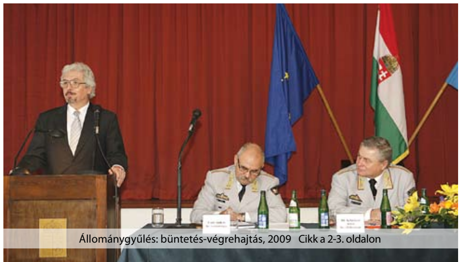
Állománygyűlés: büntetés-végrehajtás, 2009 Cikk a 2-3. oldalon

Az év végi ünnepek után új lendülettel léptünk 2010-be. Olyannyira, hogy mint látják, az újság külleme is megújult. A lap szerkezetét meghagyva, a szerkesztési és nyomdai tapasztalatok alapján módosult új külsővel az a célunk, hogy még több, még színesebb információval szolgálhassunk a Bv. Hírlevél olvasóinak. Ezt az évet is szervezetünk hagyományos állománygyűlése nyitotta. Az eseményen mi is ott voltunk, az országos parancsnok, valamint a miniszter értékelését és legfontosabb gondolatait megosztjuk Önökkel. Az új év változásokat hozott az adózásban és a béren kívüli juttatások rendszerében egyaránt. Erről, és a már lezajlott szervezeti változásokról az egyes területek vezető szakemberei nyilatkoztak lapunknak.