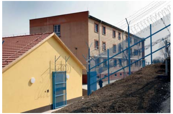
Átadták a Közép-dunántúli Országos Bv. Intézet felújított martonvásári objektumát (2015. március 23.)