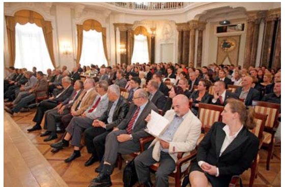
A huszonöt éves Magyar Börtönügyi Társaság ünnepi közgyűlését tartották meg az ELTE Állam- és Jogtudományi Karának dísztermében (2015. május 28.)