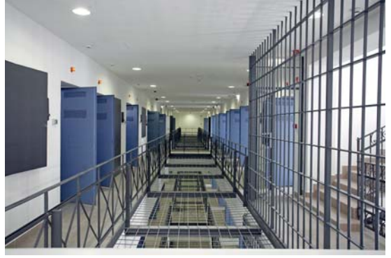
Új fogvatartotti körletet adtak át a Budapesti Fegyház és Börtönben (2015. március 16.)