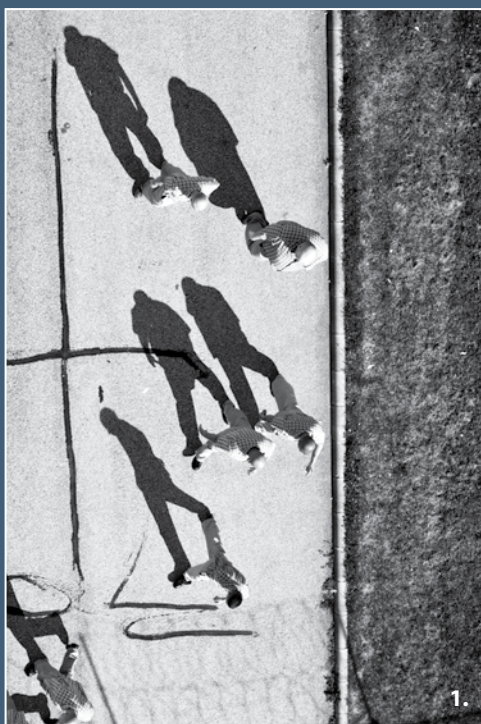
1. Pató Irina - Önmagunk árnyékában