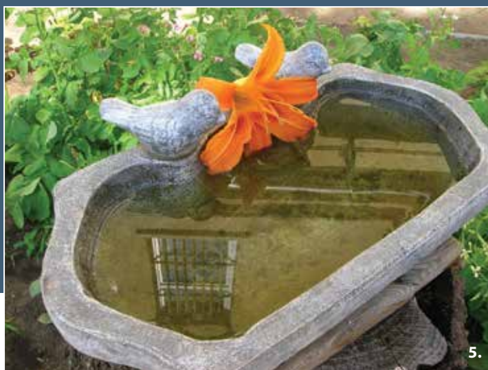
5. Tóth Ágnes - Fantázia és valóság