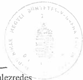
Gyenge István bv. alezredes büntetés-végrehajtási tanácsos költségvetési szerv gazdasági vezetője