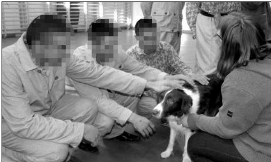
A kialakítandó gyógyító-nevelő csoport „várományosai” terápiás foglalkozáson vesznek részt a szirmabesenyői Fiatalkorúak Regionális Bv. Intézetében

Az ispotályokban, menhelyeken élő, hátrányos helyzetű emberek állapotának javítására, illetve a társadalomba történő visszahelyezkedésük elősegítésére már a közép-korban segítségül hívták a társállatokat. Az állatasszisztált terápiát mint módszert B. Levinson amerikai pszichológus dolgozta ki az 1960-as években, először érzelmileg zavart, illetve árva gyerekek gyógyítására. A módszert később kiterjesztette súlyos, gyógyíthatatlan betegek segítésére (enyhítette a depressziójukat), illetve idősekre, akiknél