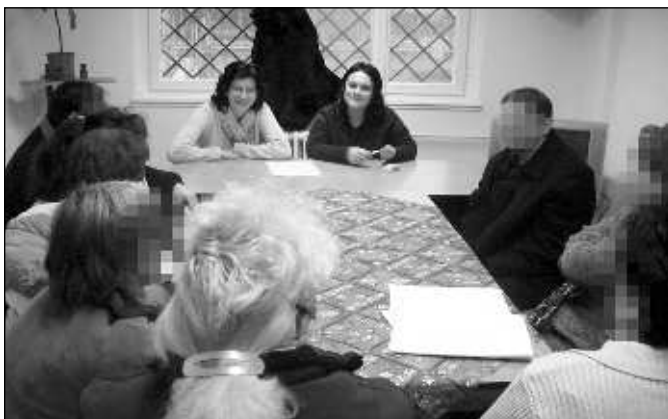
Szülői csoport foglalkozása a szirmabesenyői Fiatalok Regionális Bv. Intézetében

Bár az európai büntetés-végrehajtási gyakorlatban való alkalmazására konkrét példát nem találtam, az angol nyelvű szakirodalom bőséges helyet szentel a családterápia intézményének. A büntetőintézetben végzett családterápia mint program nem csupán a