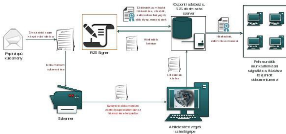
1. ábra: Papíralapú iratról hiteles elektronikus másolat készítésének rendszerszintű feldolgozási folyamata

Az elektronikus aláírás, a metaadatrendszer elektronikus példányra történő bekerülésének biztonságát a szerver oldali feldolgozás biztosítja.