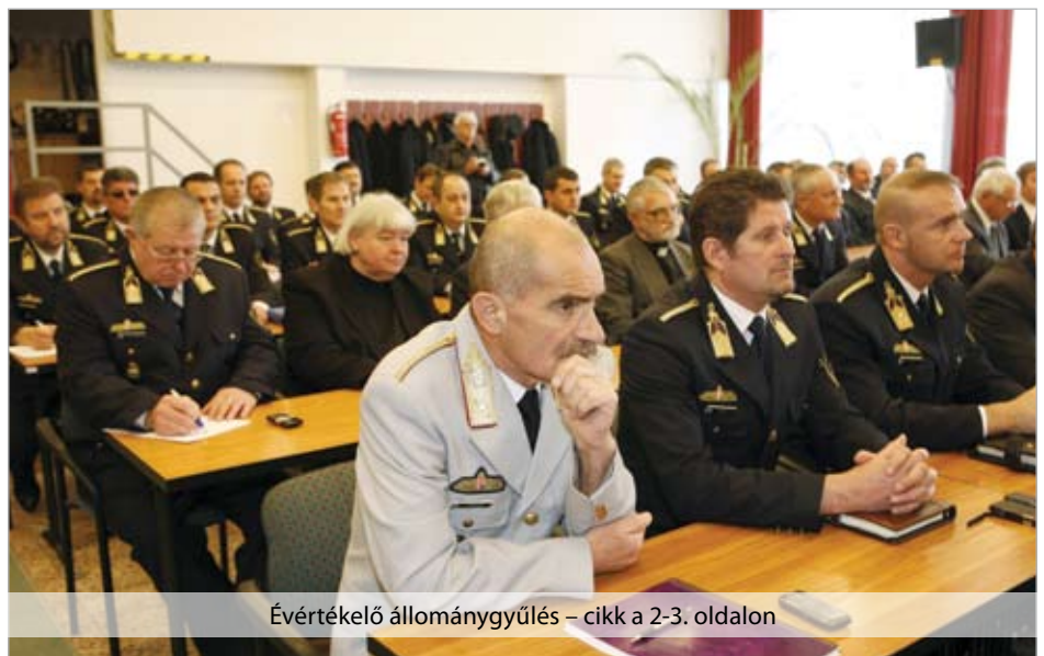
Évértékelő állománygyűlés – cikk a 2-3. oldalon